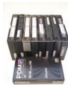
Lot de neuf cassettes vidéo, premiers modèles. (2001.1126.1)