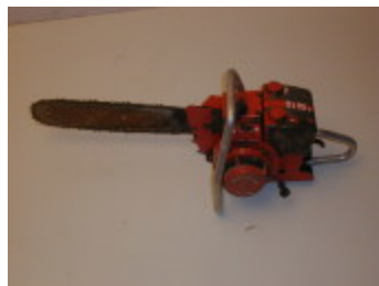
Tronçonneuse Homelite 500 (2000.1871.1)