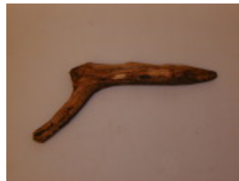
Le plantoir (2000.511.9)