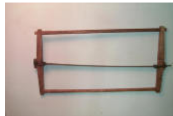
Scie à refendre (2000.190.1 (a)(b))