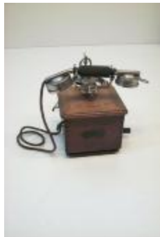
Téléphone Marty (2001.650.1)