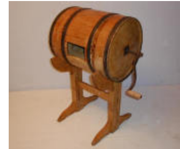
Baratte ronde (2000.405.1(1)(2))