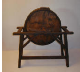
Baratte ronde (2000.382.1(1)(2)(3))