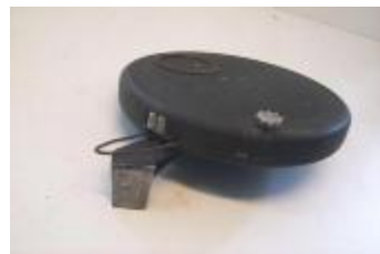
Boîte à bobines de film. (2001.1123.1)