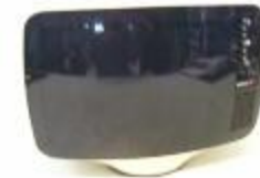
Téléviseur Téléavia Portavia P111. (2001.1107.1)