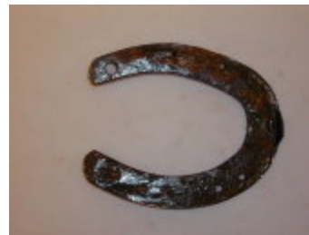
Fer à cheval (2000.511.20)