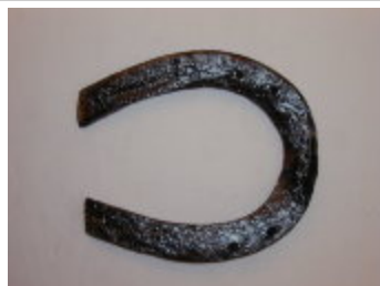
Fer à cheval (2000.1072.1)