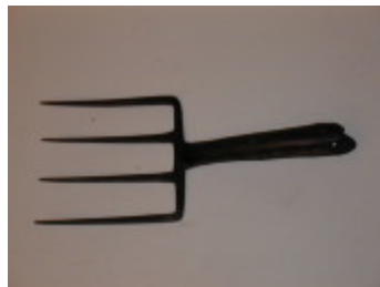
Triandine ( ou bêche à quatre dents) (2000.1719.1)