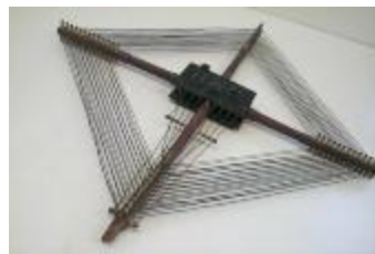
Antenne radio (2001.730.1)