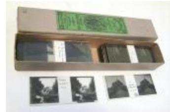
Vues stéréoscopiques (Vues sur verre pour Glyphoscope). (2001.682.1 (3))