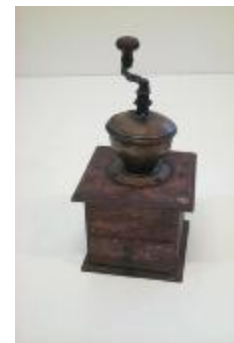
Moulin à café (2001.38.1)