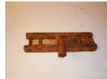
Crécelle ( 2000.583.1)