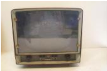
Téléviseur Radiola. (2001.1145.1)