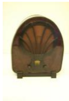
Poste de radio, modèle 830A Philips (2001.716.1)