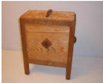
Baratte carrée (2000.411.1(1)(2))