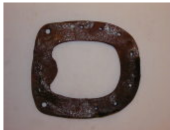
Fer à cheval. (2000.1033.1)