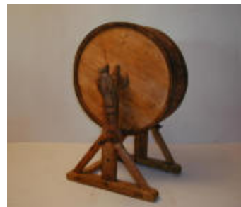
Baratte ronde (2000.231.1(1)(2))