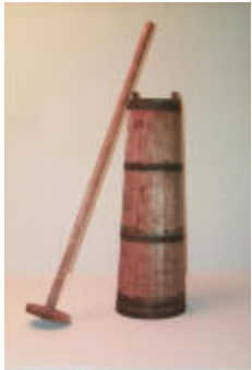
Baratte verticale et battoir (2000.102.1(a)(b))