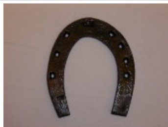
Fer à cheval (2000.1043.1)