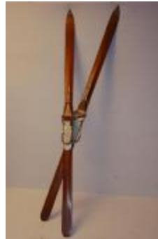
Skis (paire de) (2000.292.1)