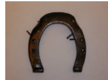
Fer à cheval (2000.1036.1)