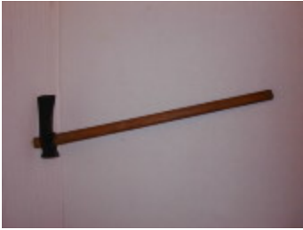
Forme pour fer à bœuf (2000.1118.1)