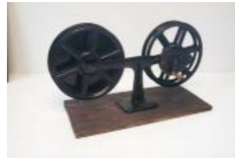
Bobineuse de films. (2001.1192.1(1)(2)(3)(4))