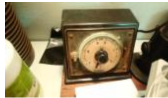
Minuteur pour photographe. (2012.18.01)