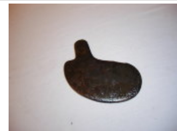
Forme pour fer à bœuf (2000.1116.1)