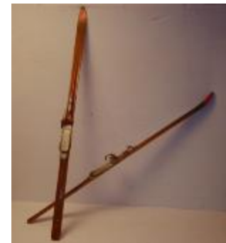
Skis (paire de) (2000.233.1)