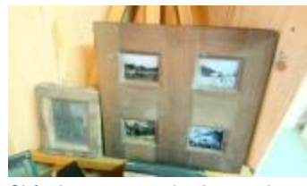
Châssis-press quadruple pour tirage photographique. (2001.666.1)