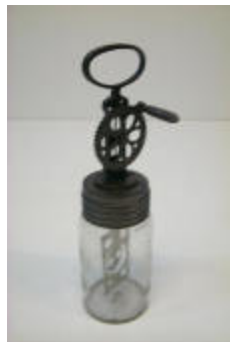
Baratte de ménage (2001.189.1(1)(2))