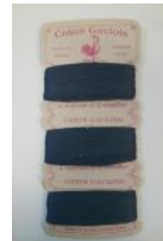
Écheveaux de coton à repriser (2001.337.1)