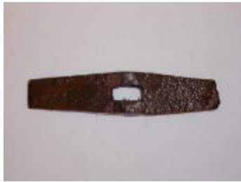
Marteau pour tailler les meules. (2000.883.1)