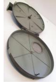
Boîte à bobines de film. (2001.1140.1)