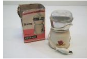
Moulin à café (2001.644.1)