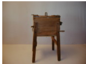
Baratte carrée (2000.228.1(1)(2))