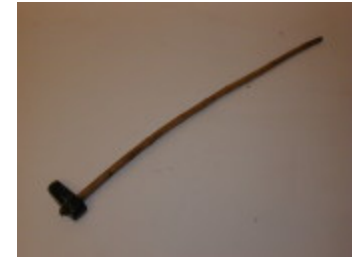
Masse de tailleur de pierre. (2000.1537.1)