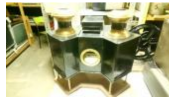
Lanterne magique (2001.1104.1)