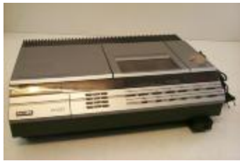
Magnéscope Philips avec télécommande. (2001.1065.1.1 à 3)