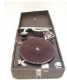
Phonographe ou gramophone (2001.699.1)