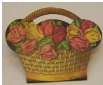
Nécessaire de couture (2001.346.1)