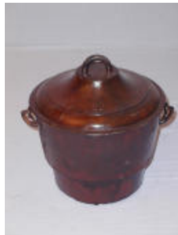
Marmite et couvercle (2000.808.1(1)(2))