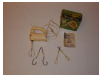
Batteur électrique (2000.1960.1)