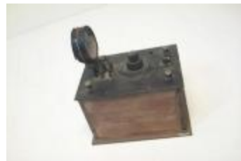
Poste de radio à Galène (2001.1073.1)