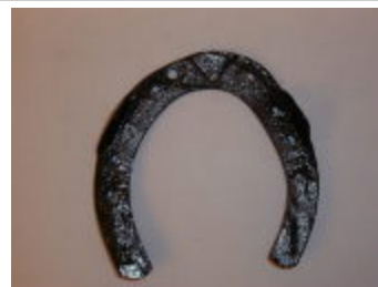
Fer à cheval (2000.1057.1)