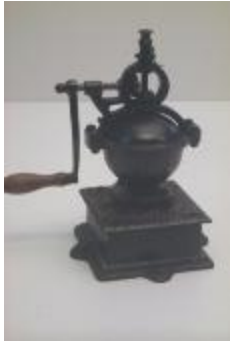
Moulin à café (2001.40.1)