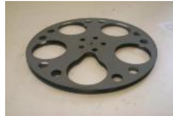
Carter de bobine de film. (2001.1139.1)