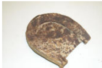
Fer à cheval orthopédique. (2001.1441.1)