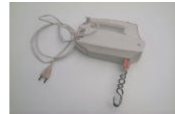
Robot moulinex (2001.92.1(1)(2)(3)(4)(5)(6)(7))