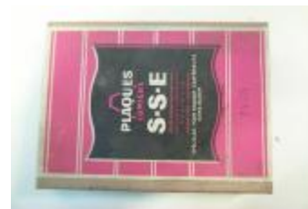
Boîte de plaques photographiques Lumière SSE. (2001.669.1)