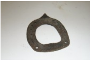
Fer à cheval orthopédique (2001.1408.1)