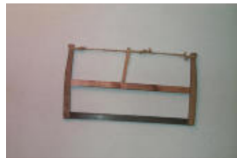
Scie à battants (2000.169.1)