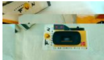
Appareil photographique Kodak, modèle Fun Panoramic. (2001.674.1(1)(2))