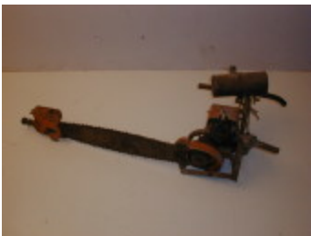
Tronçonneuse REXO (2000.1869.1)