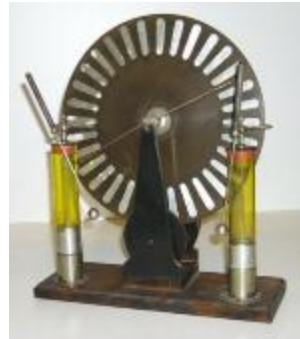
Machine de Wimshurst (2001.927.1)