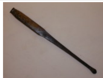
Ciseaux de tailleur (2000.1080.1 )