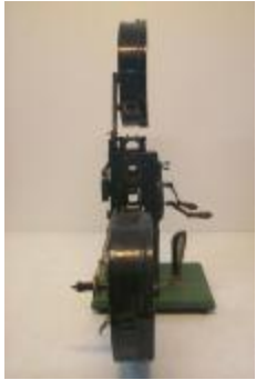
Projecteur de films. (2001.1135.1)