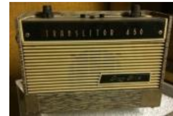
Poste de radio (2001.1013.1)