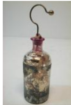
Bouteille de Leyde (2001.907.1)