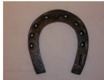
Fer à cheval (2000.1035.1)