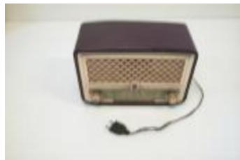
Poste de radio (2001.687.1)