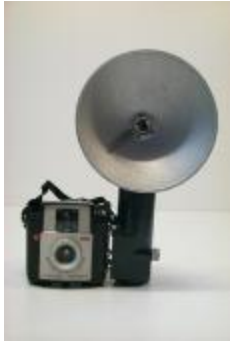
Appareil photographique Kodak, modèle Brownie Starlet, avec flash. (2001.671.1)