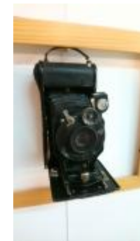
Appareil photographique Contessa-Nettel, modèle Cocarette. (2001.663.1)