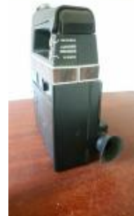
Caméra Kodak, modèle Ektasound 130 Super 8. (2001.662.1)