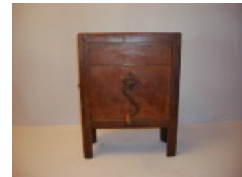
Baratte carrée (2000.216.1)