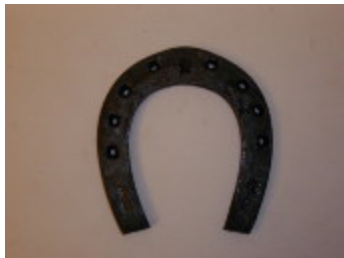
Fer à cheval (2000.1038.1)