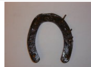
Fer à cheval (2000.1061.1)