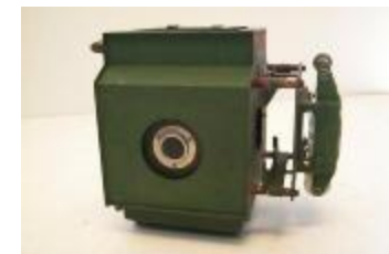
Projecteur à diapositives, Maison de la Bonne Presse. (2001.1128.1)