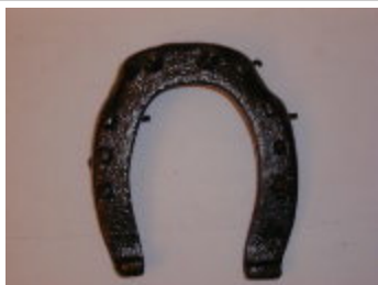
Fer à cheval (2000.1062.1)