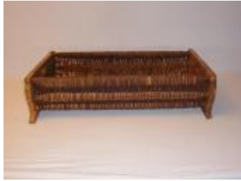
Corbeille à sécher les fruits (2000.290.1)