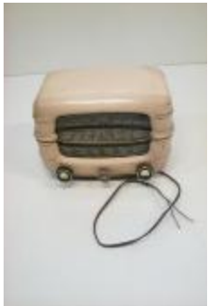
Poste de radio (2001.685.1)