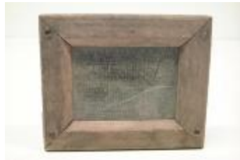
Châssis-presse simple pour tirage photographique. (2001.673.1)