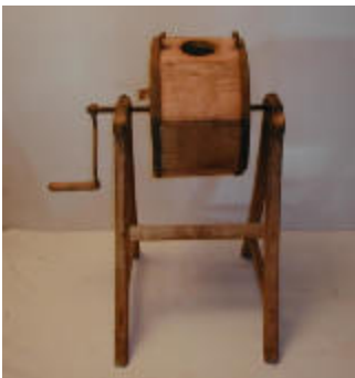
Baratte ronde (2000.220.1)