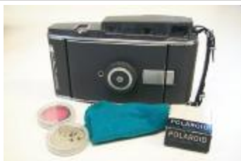
Polaroid, Modèle 120 (2001.664.1.(1) à (7))