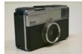
Appareil photographique Kodak, modèle Instamatic 133. (2001.670.1)