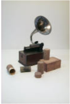
Phonographe à cylindre PATHÉ ( 2001.879.1(1)(2)(3)(4)(5)(6))