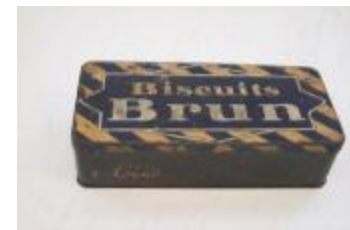
Boîte à biscuits (2001.801.1)