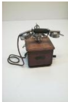
Téléphone Marty (2001.650.1)