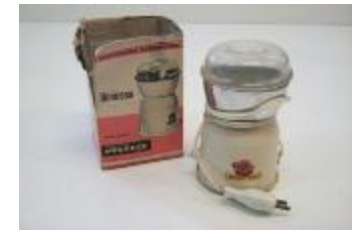
Moulin à café (2001.644.1)