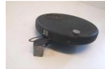
Boîte à bobines de film. (2001.1123.1)