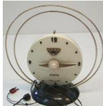
Antenne radio (2001.637.1)