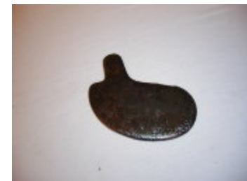
Forme pour fer à bœuf (2000.1116.1)