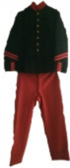
Uniforme de soldat (AHT 2023)