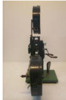
Projecteur de films. (2001.1135.1)