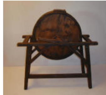
Baratte ronde (2000.382.1(1)(2)(3))