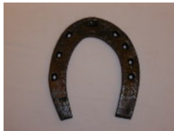
Fer à cheval (2000.1043.1)