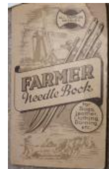
Nécessaire de couture (2001.340.1)