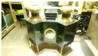
Lanterne magique (2001.1104.1)