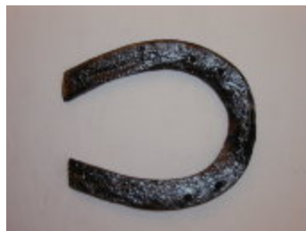
Fer à cheval (2000.1072.1)