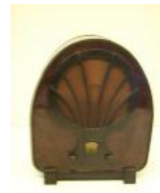
Poste de radio, modèle 830A Philips (2001.716.1)