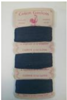
Écheveaux de coton à repriser (2001.337.1)