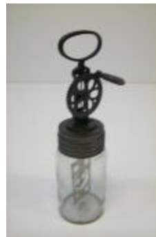
Baratte de ménage (2001.189.1(1)(2))