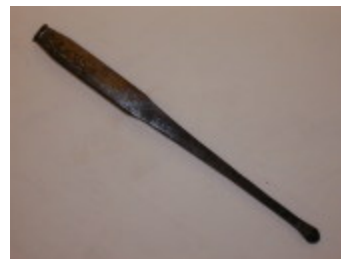
Ciseaux de tailleur (2000.1080.1 )