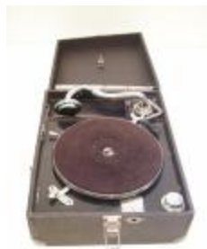
Phonographe ou gramophone (2001.699.1)