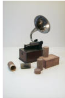
Phonographe à cylindre PATHÉ (2001.879.1(1)(2)(3)(4)(5)(6))