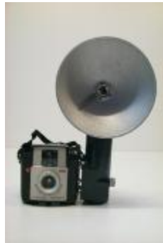
Appareil photographique Kodak, modèle Brownie Starlet, avec flash. (2001.671.1)