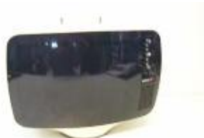
Téléviseur Téléavia Portavia P111. (2001.1107.1)