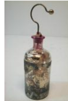
Bouteille de Leyde (2001.907.1)