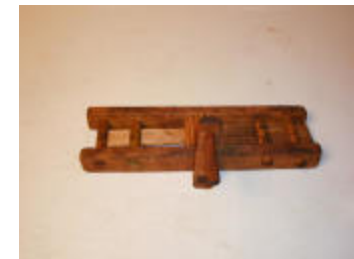
Crécelle ( 2000.583.1)