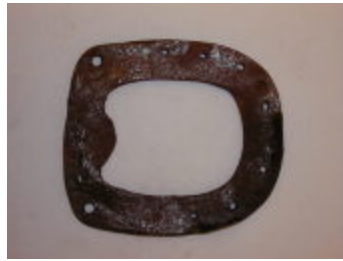
Fer à cheval. (2000.1033.1)