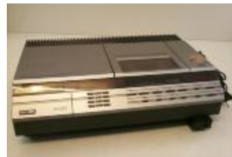
Magnétophone Philips avec télécommande. (2001.1065.1.1 à 3)