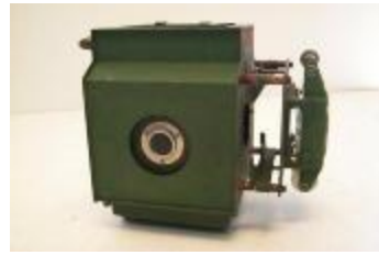
Projecteur à diapositives, Maison de la Bonne Presse. (2001.1128.1)