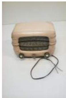
Poste de radio (2001.685.1)