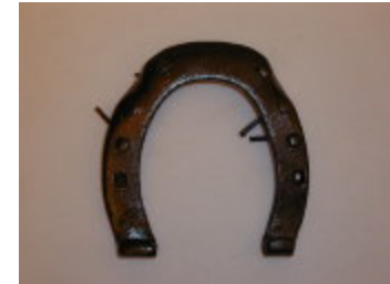
Fer à cheval (2000.1036.1)