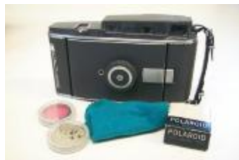
Polaroid, Modèle 120 (2001.664.1.(1) à (7))