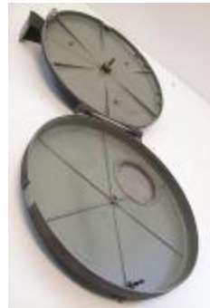
Boîte à bobines de film. (2001.1140.1)