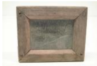
Châssis-presse simple pour tirage photographique. (2001.673.1)