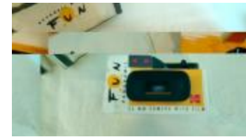
Appareil photographique Kodak, modèle Fun Panoramic. (2001.674.1(1)(2))