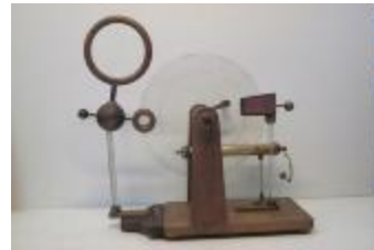
Machine de Winter (2001.1121.1)