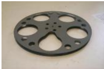
Carter de bobine de film. (2001.1139.1)