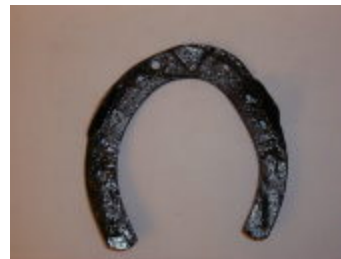
Fer à cheval (2000.1057.1)