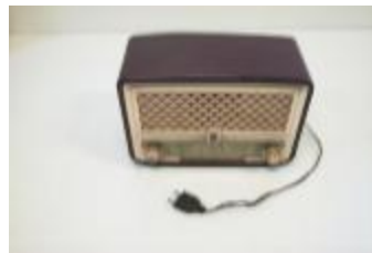
Poste de radio (2001.687.1)