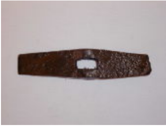
Marteau pour tailler les meules. (2000.883.1)