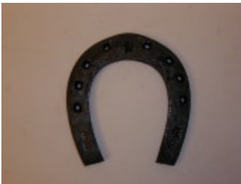
Fer à cheval (2000.1038.1)