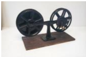
Bobineuse de films. (2001.1192.1(1)(2)(3)(4))