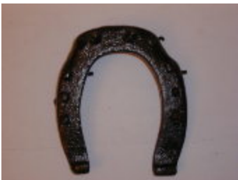
Fer à cheval (2000.1062.1)