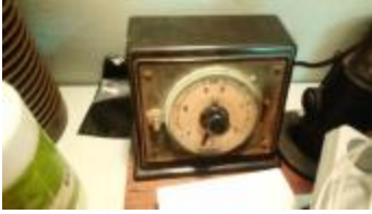
Minuteur pour photographe. (2012.18.01)