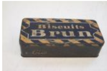
Boîte à biscuits (2001.801.1)