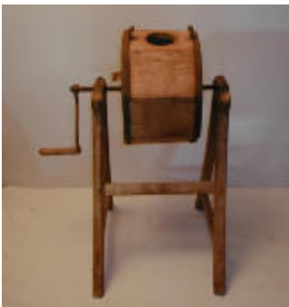
Baratte ronde (2000.220.1)