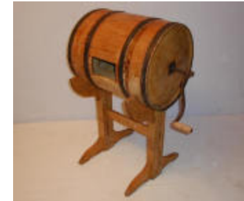
Baratte ronde (2000.405.1(1)(2))