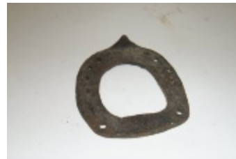
Fer à cheval orthopédique (2001.1408.1)