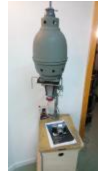
Agrandisseur de photographies (2001.1136.1)