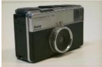
Appareil photographique Kodak, modèle Instamatic 133. (2001.670.1)