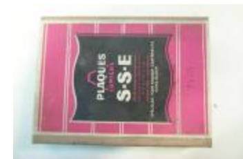
Boîte de plaques photographiques Lumière SSE. (2001.669.1)