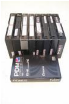
Lot de neuf cassettes vidéo, premiers modèles. (2001.1126.1)