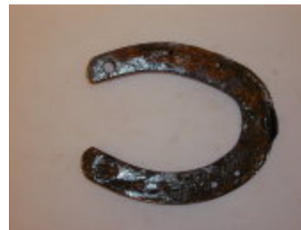
Fer à cheval (2000.511.20)