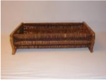
Corbeille à sécher les fruits (2000.290.1)