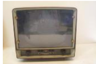
Téléviseur Radiola. (2001.1145.1)