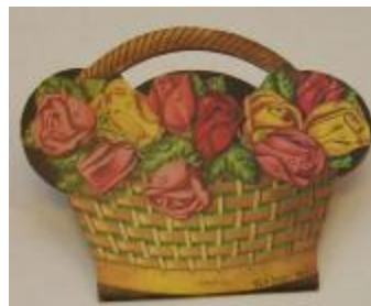
Nécessaire de couture (2001.346.1)