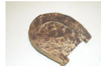
Fer à cheval orthopédique. (2001.1441.1)