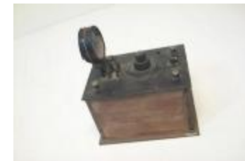
Poste de radio à Galène (2001.1073.1)