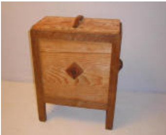
Baratte carrée (2000.411.1(1)(2))