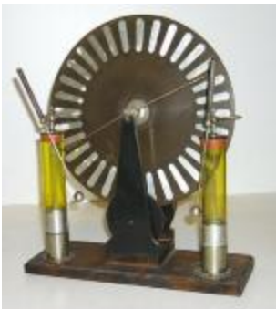
Machine de Wimshurst (2001.927.1)