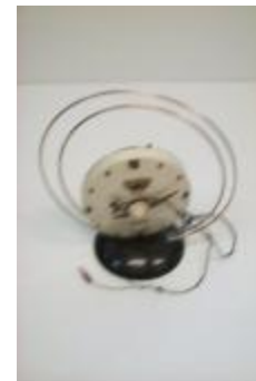
Antenne radio (2001.690.1)