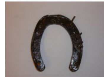
Fer à cheval (2000.1061.1)