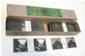
Vues stéréoscopiques (Vues sur verre pour Glyphoscope). (2001.682.1 (3))