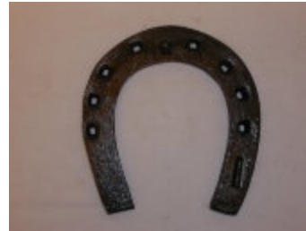
Fer à cheval (2000.1035.1)