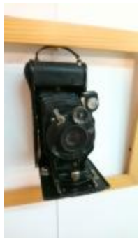
Appareil photographique Contessa-Nettel, modèle Cocarette. (2001.663.1)