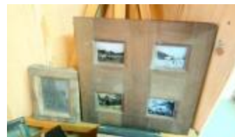
Châssis-presses quadruple pour tirage photographique. (2001.666.1)