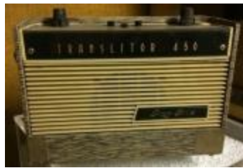
Poste de radio (2001.1013.1)