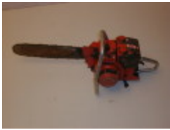
Tronçonneuse Homelite 500 (2000.1871.1)