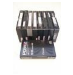
Lot de neuf cassettes vidéo, premiers modèles. (2001.1126.1)