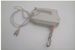
Robot moulinex (2001.92.1(1)(2)(3)(4)(5)(6)(7))