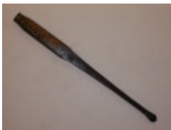
Ciseaux de tailleur (2000.1080.1 )