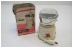
Moulin à café (2001.644.1)