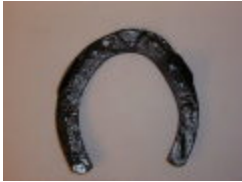
Fer à cheval (2000.1057.1)