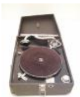
Phonographe ou gramophone (2001.699.1)