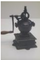
Moulin à café (2001.40.1)