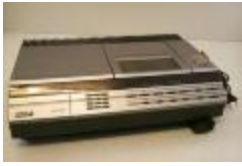
Magnétoscope Philips avec télécommande. (2001.1065.1.1 à 3)