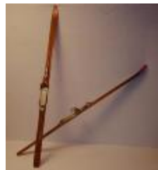
Skis (paire de) (2000.233.1)