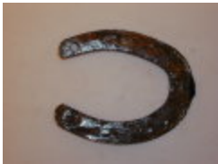
Fer à cheval (2000.511.20)