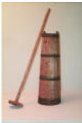
Baratte verticale et battoir (2000.102.1(a)(b))