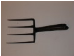
Triandine ( ou bêche à quatre dents) (2000.1719.1)