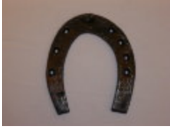
Fer à cheval (2000.1043.1)