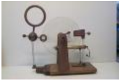
Machine de Winter (2001.1121.1)