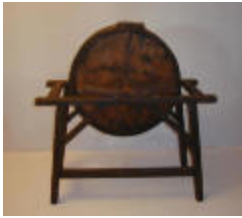
Baratte ronde (2000.382.1(1)(2)(3))