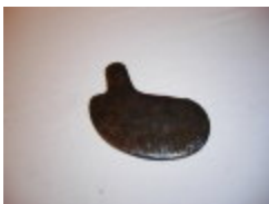
Forme pour fer à bœuf (2000.1116.1)