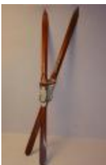
Skis (paire de) (2000.292.1)