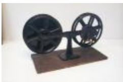
Bobineuse de films. (2001.1192.1(1)(2)(3)(4))