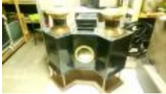
Lanterne magique (2001.1104.1)