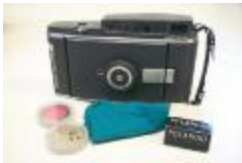
Polaroid, Modèle 120 (2001.664.1.(1) à (7))