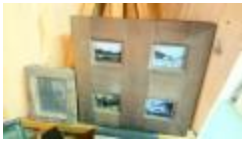
Châssis-presse quadruple pour tirage photographique. (2001.666.1)