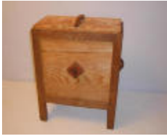
Baratte carrée (2000.411.1(1)(2))