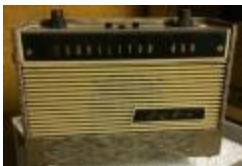
Poste de radio (2001.1013.1)