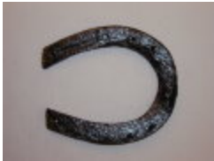
Fer à cheval (2000.1072.1)