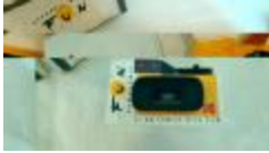
Appareil photographique Kodak, modèle Fun Panoramic. (2001.674.1(1)(2))