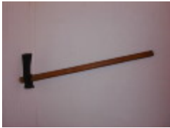
Forme pour fer à bœuf (2000.1118.1)