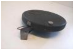
Boîte à bobines de film. (2001.1123.1)