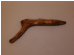
Le plantoir (2000.511.9)