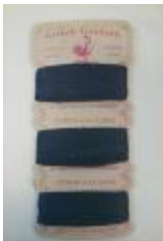
Écheveaux de coton à repriser (2001.337.1)