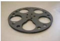
Carter de bobine de film. (2001.1139.1)