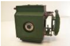
Projecteur à diapositives, Maison de la Bonne Presse. (2001.1128.1)