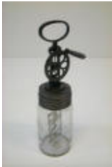
Baratte de ménage (2001.189.1(1)(2))