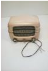
Poste de radio (2001.685.1)