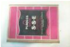
Boîte de plaques photographiques Lumière SSE. (2001.669.1)