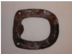
Fer à cheval. (2000.1033.1)