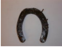
Fer à cheval (2000.1061.1)