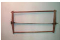
Scie à refendre (2000.190.1 (a)(b))