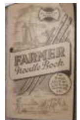
Nécessaire de couture (2001.340.1)