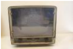
Téléviseur Radiola. (2001.1145.1)