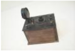
Poste de radio à Galène (2001.1073.1)