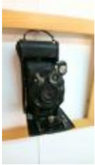
Appareil photographique Contessa-Nettel, modèle Cocarette. (2001.663.1)