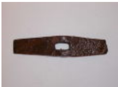
Marteau pour tailler les meules. (2000.883.1)