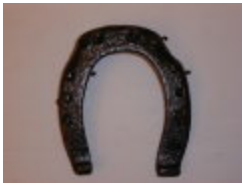
Fer à cheval (2000.1062.1)