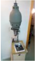
Agrandisseur de photographies (2001.1136.1)