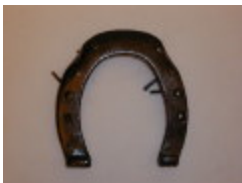
Fer à cheval (2000.1036.1)