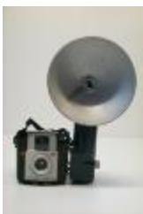
Appareil photographique Kodak, modèle Brownie Starlet, avec flash. (2001.671.1)