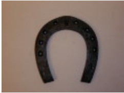
Fer à cheval (2000.1038.1)