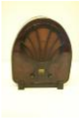
Poste de radio, modèle 830A Philips (2001.716.1)