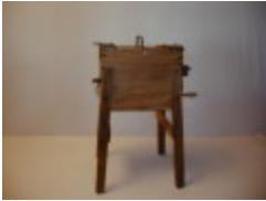
Baratte carrée (2000.228.1(1)(2))