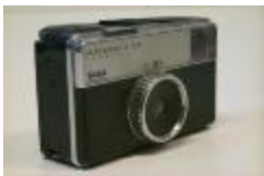
Appareil photographique Kodak, modèle Instamatic 133. (2001.670.1)