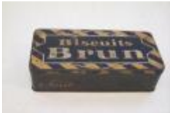
Boîte à biscuits (2001.801.1)