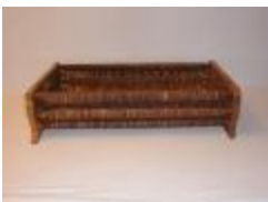
Corbeille à sécher les fruits (2000.290.1)