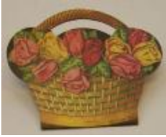
Nécessaire de couture (2001.346.1)