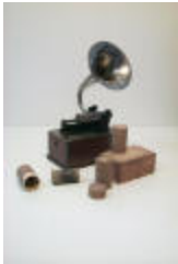
Phonographe à cylindre PATHÉ ( 2001.879.1(1)(2)(3)(4)(5)(6))