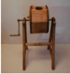
Baratte ronde (2000.220.1)