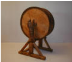
Baratte ronde (2000.231.1(1)(2))