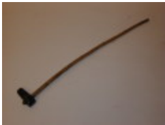
Masse de tailleur de pierre. (2000.1537.1)