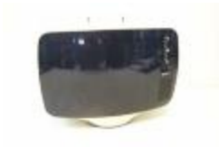
Téléviseur Téléavia Portavia P111. (2001.1107.1)