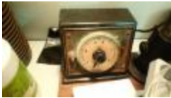
Minuteur pour photographe. (2012.18.01)