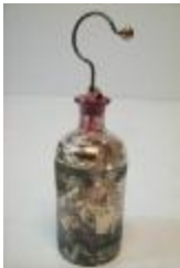
Bouteille de Leyde (2001.907.1)