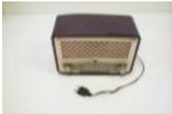
Poste de radio (2001.687.1)