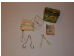
Batteur électrique (2000.1960.1)