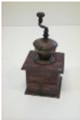
Moulin à café (2001.38.1)