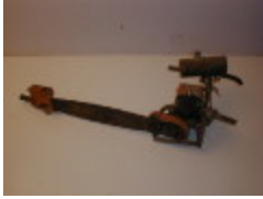
Tronçonneuse REXO (2000.1869.1)