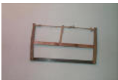
Scie à battants (2000.169.1)