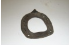
Fer à cheval orthopédique (2001.1408.1)