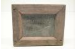
Châssis-presse simple pour tirage photographique. (2001.673.1)