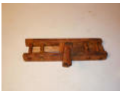
Crécelle ( 2000.583.1)