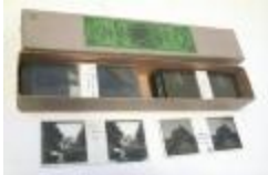
Vues stéréoscopiques (Vues sur verre pour Glyphoscope). (2001.682.1 (3))