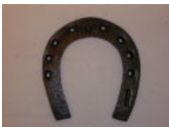
Fer à cheval (2000.1035.1)