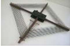
Antenne radio (2001.730.1)