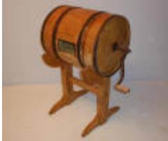
Baratte ronde (2000.405.1(1)(2))