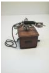
Téléphone Marty (2001.650.1)