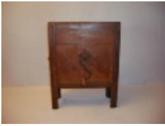
Baratte carrée (2000.216.1)