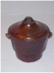
Marmite et couvercle (2000.808.1(1)(2))