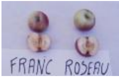
Franc roseau du Valais (PAY_HR)