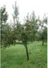
Reinette blanche du Canada (PAY_DE)