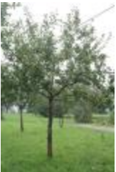
Rambour rouge (PAY_GJ)