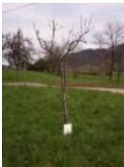
Rambour blanc (PAY_HO)