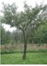
Reinette de Chevroux (PAY_DP)