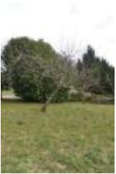
Croison Mitron (PAY_AI)