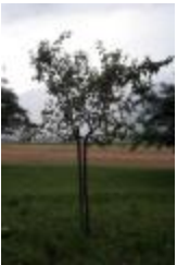
Croison couteau (PAY_D)