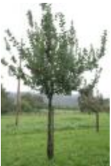
Reinette petite grise (PAY_DN)