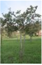
Rambour d'hiver (PAY_GB)