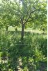
Calville d'hiver (PAY_BD)