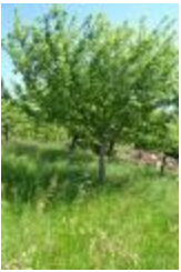
Croison Mitron (PAY_AJ)