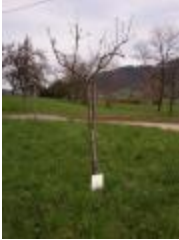
Rambour blanc (PAY_BZ)