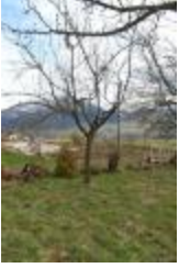
Croison blanc de Marcellaz (PAY_N)