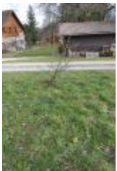
Arbre sauvage (PAY_Y)