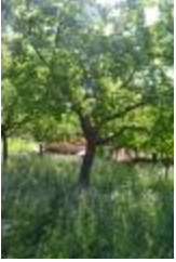
Reinette dorée (PAY_CP)