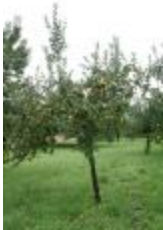
Reinette blanche (PAY_G)