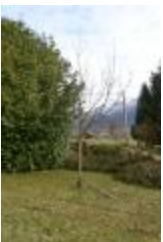
Double rose (PAY_T)