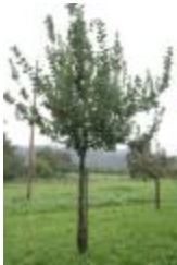
Reinette petite grise (PAY_FT)