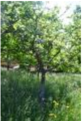
Beurré Gris (PAY_DA)