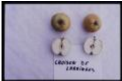
Croison Larringes (PAY_EB)