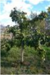
Cognassier Champion (PAY_DQ)