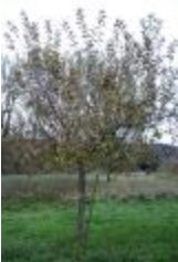
Api étoilée (PAY_DW)