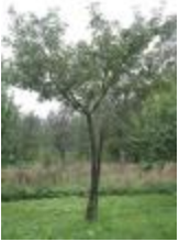
Reinette de Chevroux (PAY_DK)