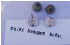
Normand blanc (PAY_ET)