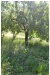
Api étoilée (PAY_AU)