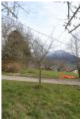
Reinette de Savoie (PAY_W)