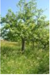
Rambour rouge (PAY_CV)