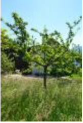
Reine des Reinettes (PAY_BP)