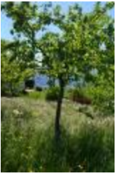
Martin sec (PAY_DC)