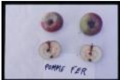
Fer de Savoie (PAY_HB)