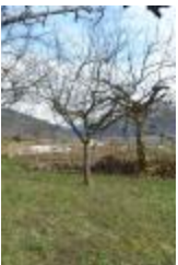
Croison blanc de Marcellaz (PAY_M)