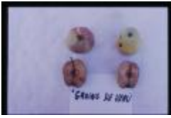
Groin de Veau (PAY_FF)