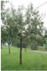
Rambour rouge (PAY_FL)