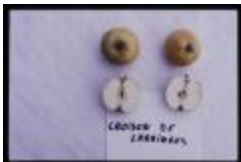
Croison Larringes (PAY_EC)