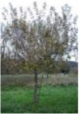
Api étoilée (PAY_GX)