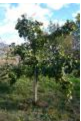
Cognassier Champion [2011] (PAY_EF)