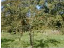
Reinette dorée (PAY_AT)