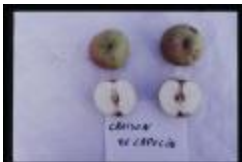
Croison capucin (PAY_BV)