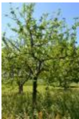
Reinette blanche (PAY_I)