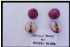
Calville rouge (PAY_HW)