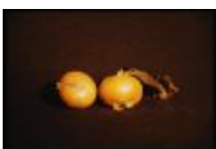
Nêfle [2011] (PAY_GL)