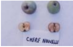
Chère Nouvelle (PAY_GU)