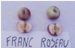
Franc roseau du Valais (PAY_GI)