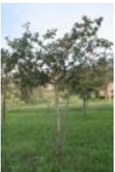
Rambour d'hiver (PAY_IN)