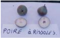
Paires à rissoles de Fillinges (PAY_EJ)