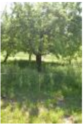
Belle de Pontoise (PAY_BB)