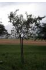
Croison couteau (PAY_DZ)