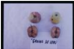
Groin de Veau (PAY_GP)