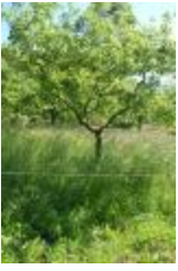
Rambour rouge (PAY_CU)