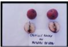
Calville rouge (PAY_II)