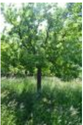
Reinette petite grise (PAY_CQ)