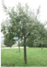
Grand Alexandre de Savoie (PAY_HU)