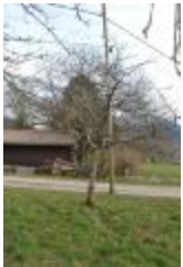
Rambour d'hiver (PAY_X)