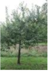
Belle de Pontoise (PAY_IX)