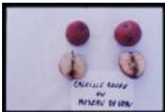
Calville rouge (PAY_HX)