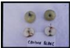
Croison blanc sauvage (PAY_DU)