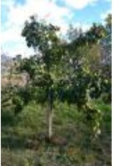
Cognassier Champion (PAY_DQ)