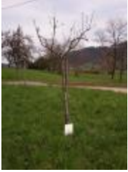
Rambour blanc (PAY_BZ)