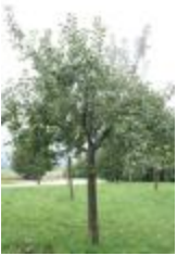
Grand Alexandre de Savoie (PAY_BS)