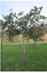
Rambour d'hiver (PAY_GB)