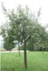
Grand Alexandre de Savoie (PAY_GK)