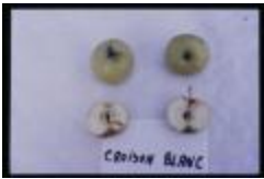
Croison blanc sauvage (PAY_DV)