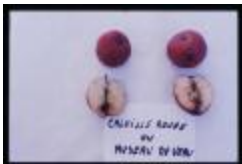
Calville rouge (PAY_HX)