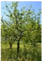
Reinette blanche (PAY_I)