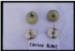
Croison blanc sauvage (PAY_DU)