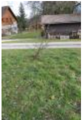
Arbre sauvage (PAY_Y)