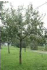
Rambour rouge (PAY_GJ)