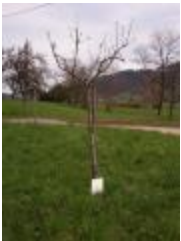
Rambour blanc (PAY_CA)