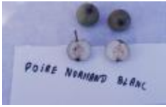
Normand blanc (PAY_ET)